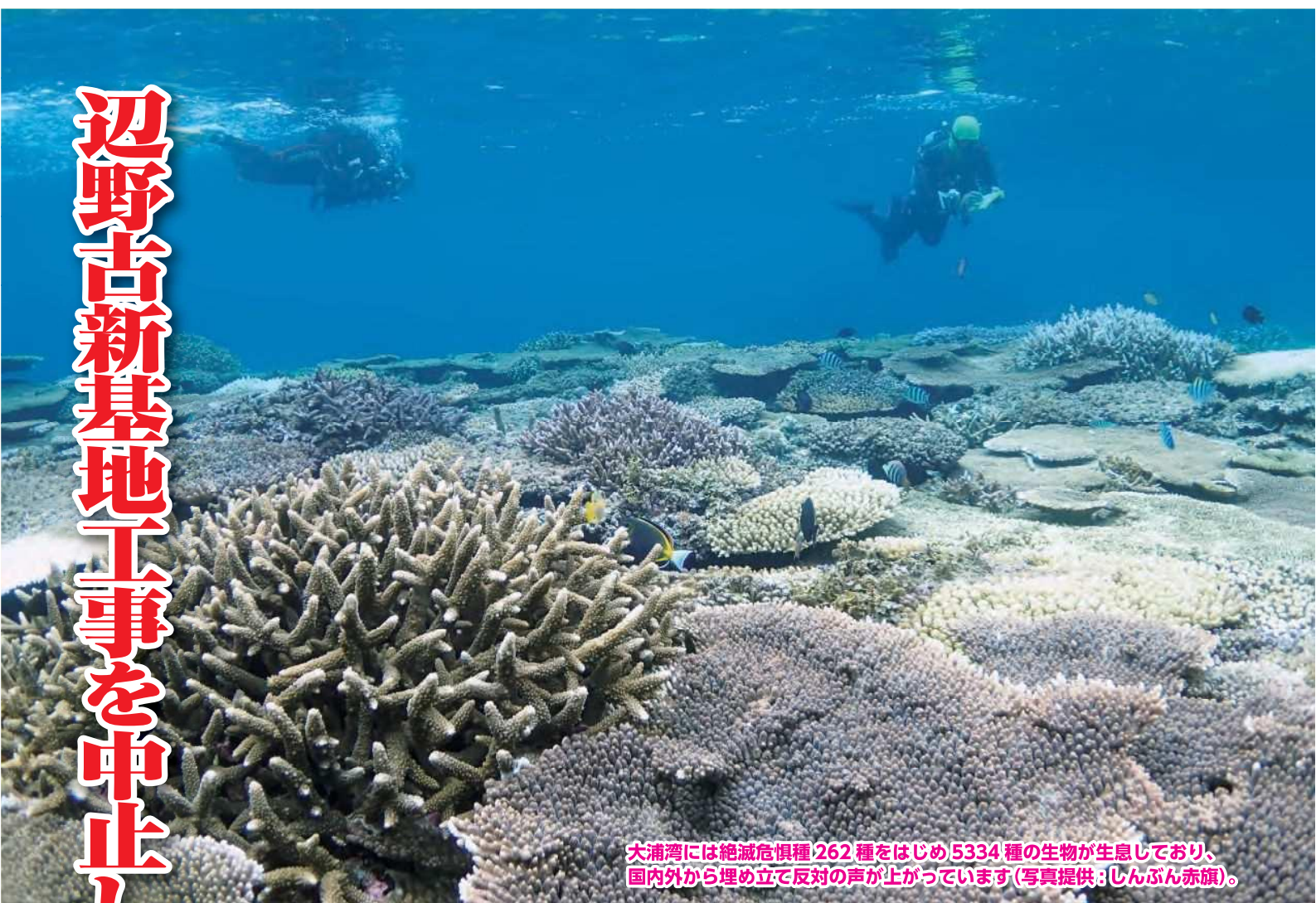
大浦湾には絶滅危惧種262種をはじめ5334種の生物が生息しており、国内外から埋め立て反対の声が上がっています。