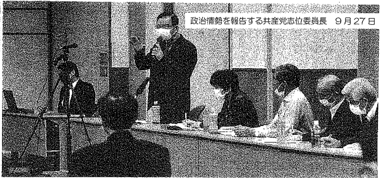
政治情勢を報告する共産党志位委員長 9月27日