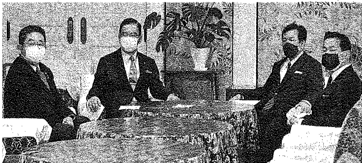
会談する志位(中央左)、枝野(中央右)の両氏。同席は小池(左)、福山の両氏=30日、国会内